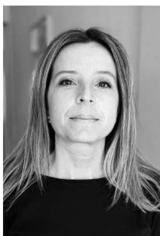
Chiara Ternullo Ternullomelo Architects